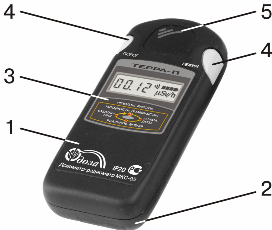
Рисунок 1.1 - Общий вид дозиметра

Корпус дозиметра (рисунки 1.1, 1.2) состоит из верхней (1) и нижней (2) крышек. В средней части верхней крышки (1) дозиметра расположена панель индикации (3), слева и справа над ней – две клавиши (4) управления работой дозиметра, а в верхней части крышки (1) – громкоговоритель (5).